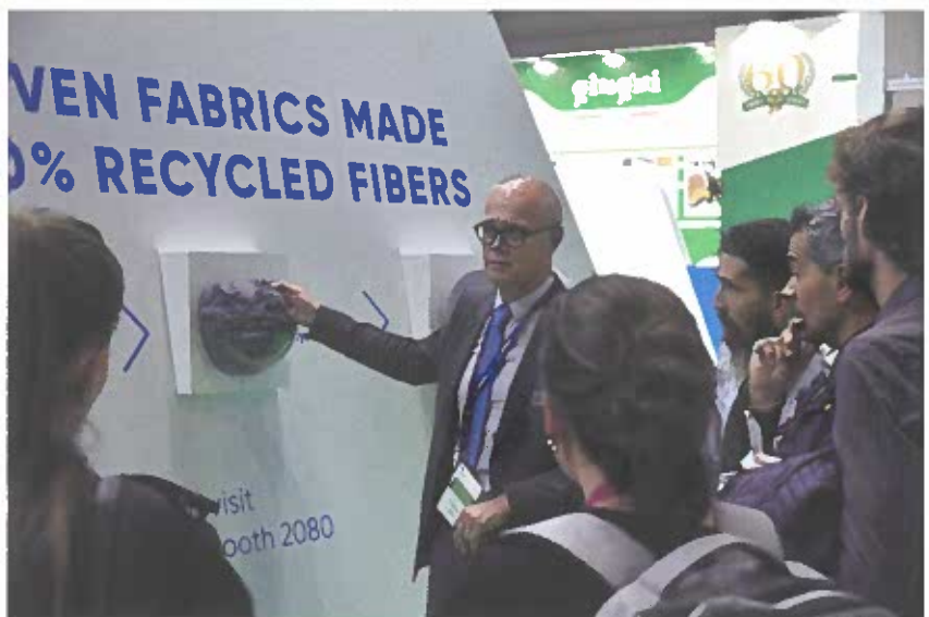
Mit der Index-App können Besucher dieses Jahr den Messebesuch planen und organisieren